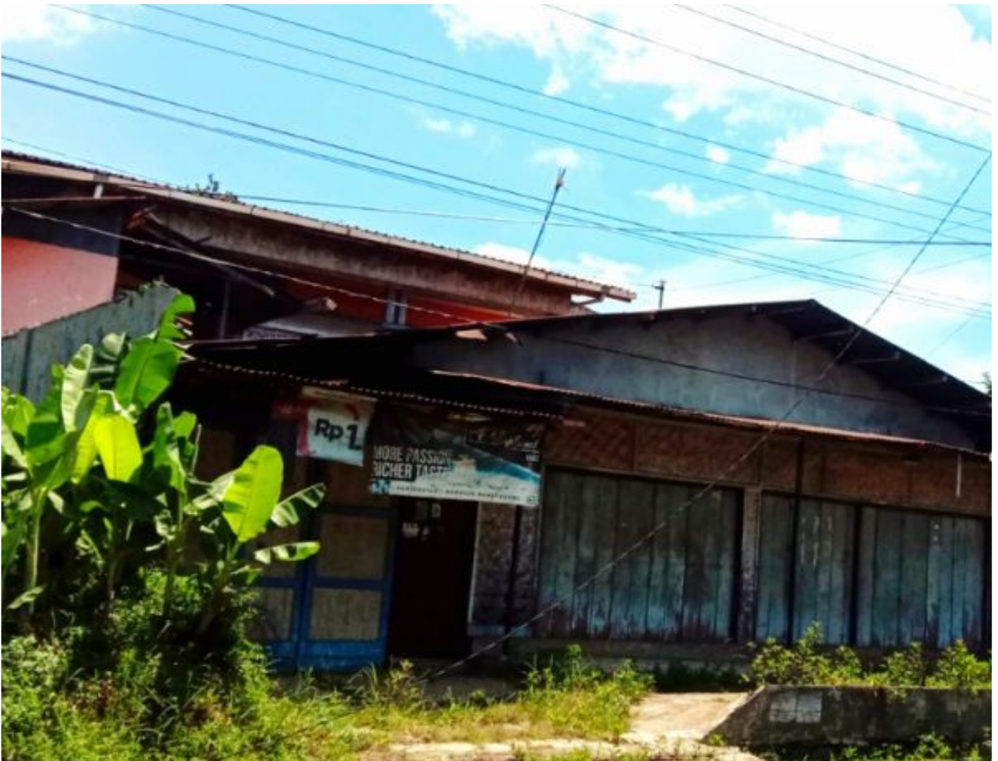
Kabel Lampu Penerangan Jalan Umum (LPJU) yang Terputus di Tepi Jalan Raya Desa Kaliori

BANYUMAS - Kabel Lampu Penerangan Jalan Umum (LPJU) yang berada disekitar tepi Jalan raya Desa Kaliori Kecamatan Kalibagor Kabupaten Banyumas, terputus dan membahayakan warga masyarakat, perlu adanya perbaikan dari Dinas terkait. Kabel LPJU yang tersebut terurai ke tanah diduga masih teraliri arus listrik.